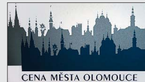
CENA MĚSTA OLMOUCE