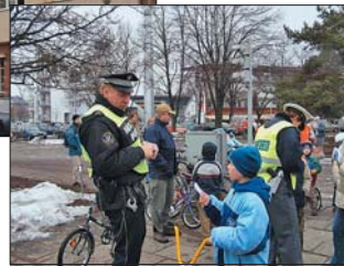
Strážníci organizují i akce pro děti