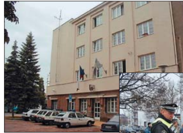
Sídlo MPO Kateřinská 23

Územní příslušnost: oddělení zahrnuje historické jádro města a jeho bezprostřední okolí, dále je tvořeno městskými částmi Svatý Kopeček, Lošov, Radíkov a Drozdín.